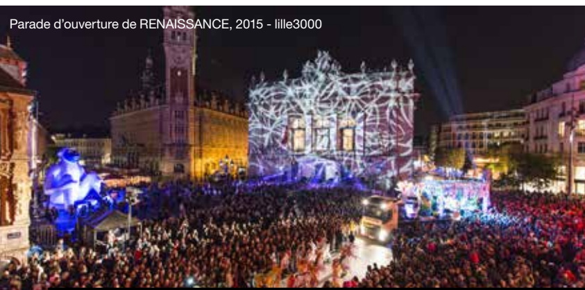
Parade d'ouverture de RENAISSANCE, 2015 - lille3000